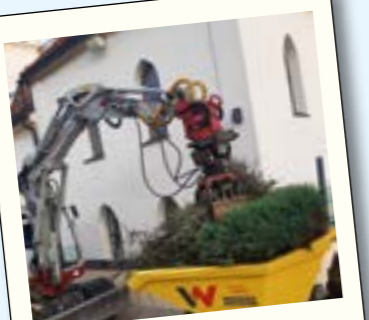
Die alte Hecke muss weg