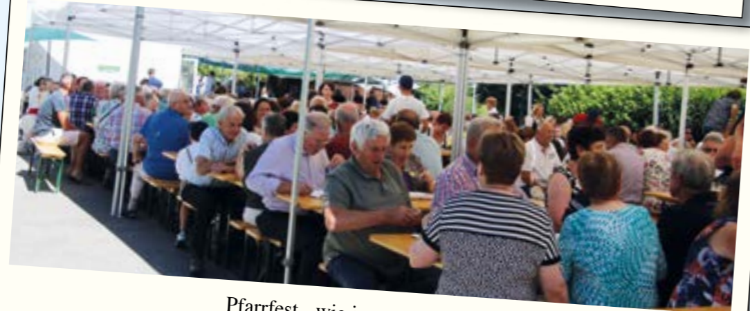
Pfarrfest - wie immer gut besucht