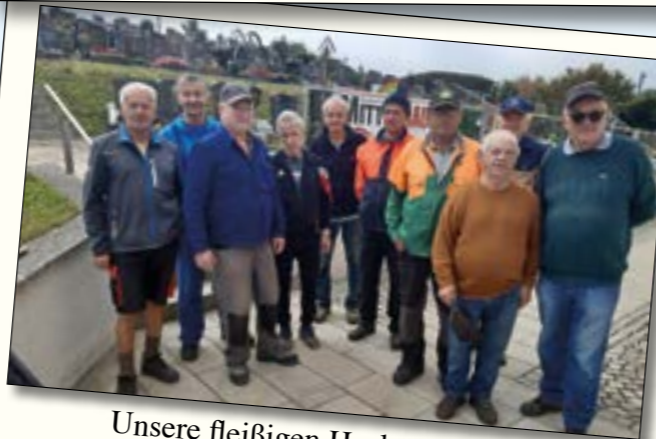
Unsere fleißigen Heckenschneider