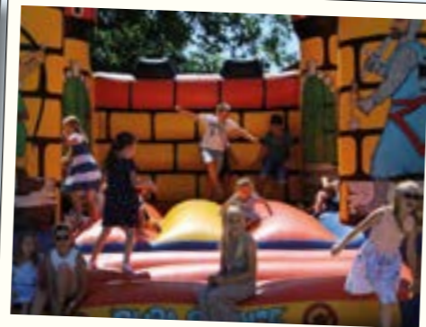
Kinder haben Spass beim Pfarrfest