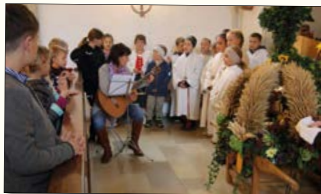
Volksschüler beim Erntedankfest