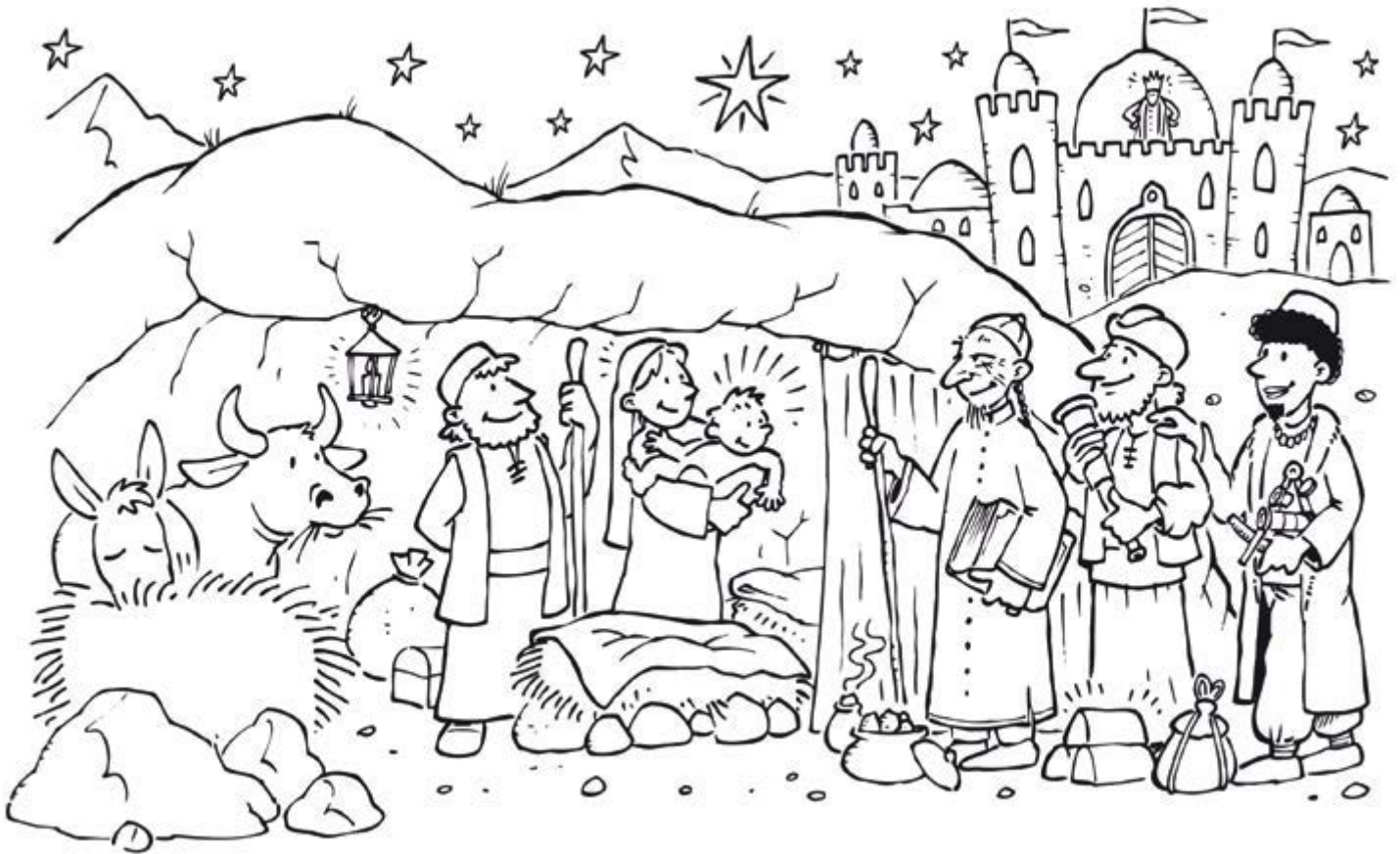
Ausmalbild zum Fest »Erscheinung des Herrn« – Dreikönige im Lesejahr A / Mt 2, 1–12