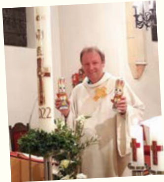
Der Osterhase kommt