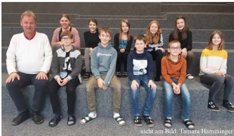
nicht am Bild: Tamara Hamminger

Unsere neuen Firmlinge haben sich am 4. Adventssonntag (18. Dezember) im Pfarrgottesdienst vorgestellt. Der nächste Einsatz wird beim Sternsingen sein (siehe S. 13!). Unsere Firmlinge werden im Religionsunterricht vorbereitet, dazu